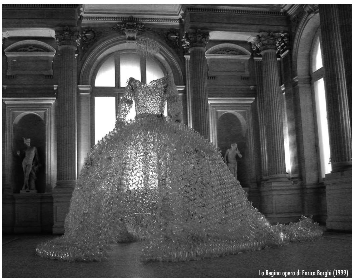
La Regina opera di Enrica Borghi (1999)